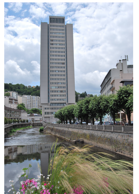
Le quai de la République