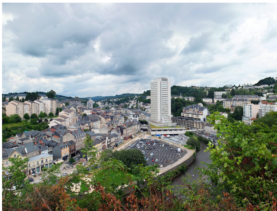
La ville vue du monuments aux morts