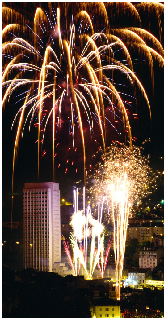
Un soir de festivités