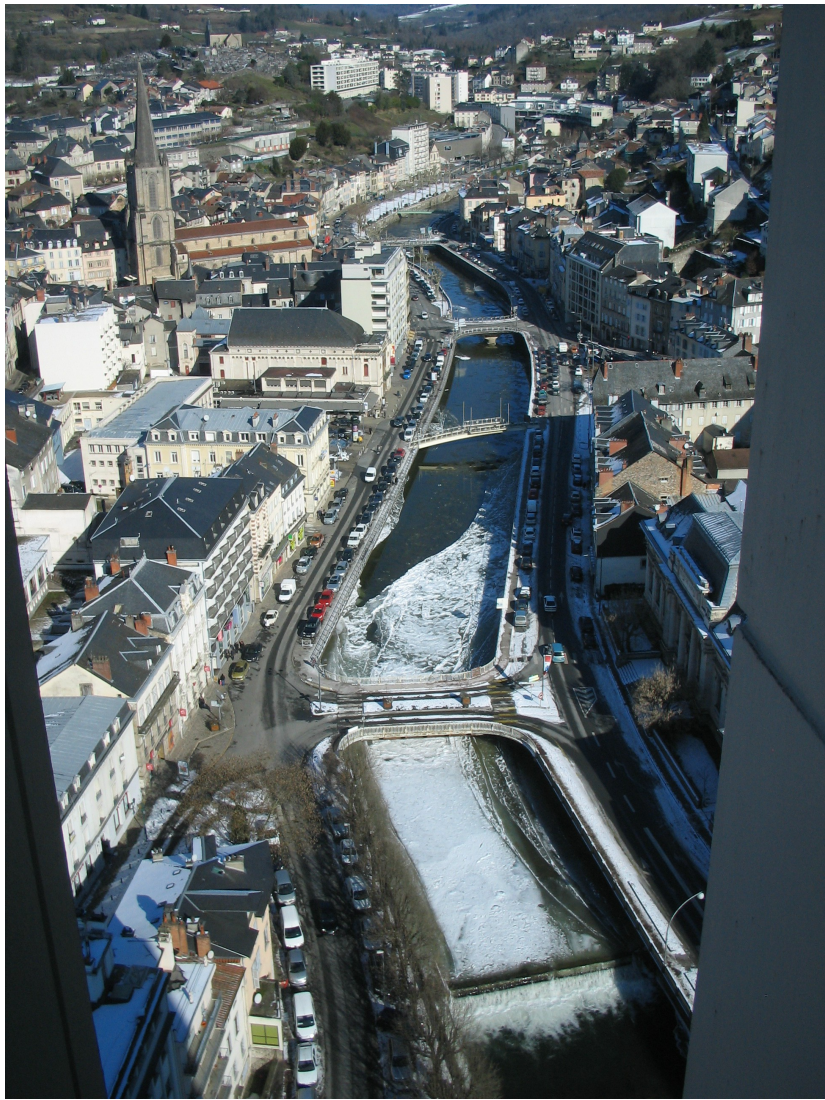
La ville vue de la cité lors d'un hiver très rigoureux (2012)