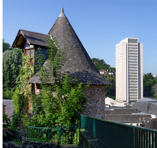
La tour du Lion et la cité