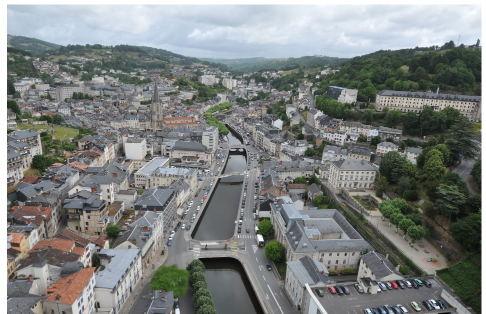
La ville vue de la cité aux beaux jours